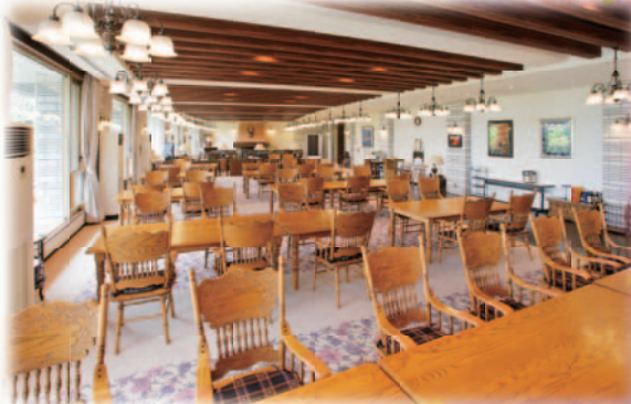
食堂 / 1階