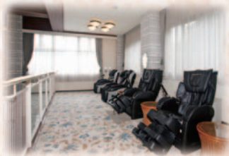
ラウンジ(マッサージ機無料)