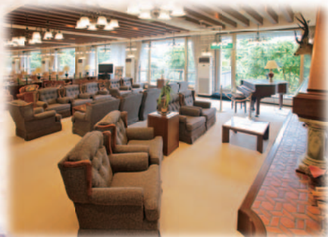
談話室 / 1階