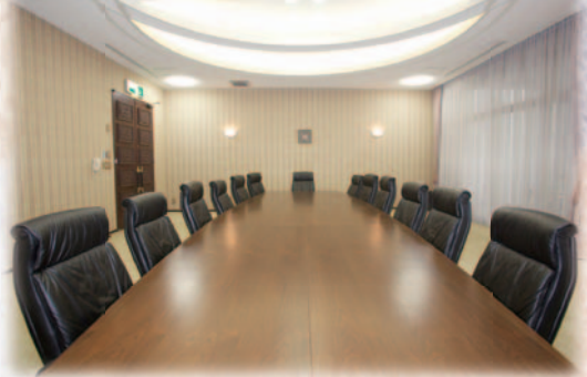
第二会議室 / 地下