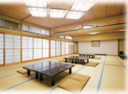
宴会場 / 1階