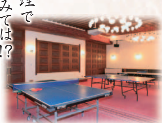
卓球室(第一会議室) / 地下